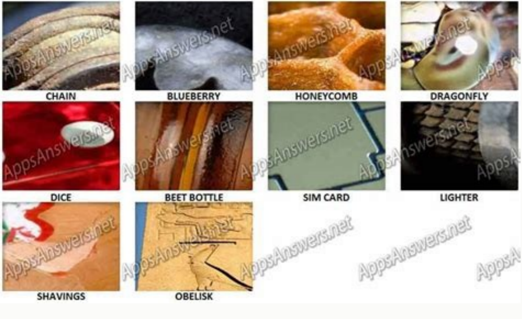
Level 20 close up pics answers.